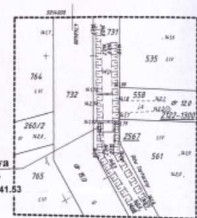
56. Przepust rozbudowa - Przyczółek wlotowy Ø 3x140 H= 0,98 m NPP 141.53

INFORMACJA O PUNKTACH OSNOWY PODSTAWOWEJ I SZCZEGÓLWEJ W GRANICACH OPRACOWANIA